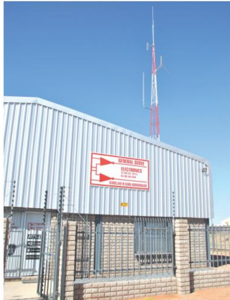
Die nuwe kommunikasie toring is 18 meter hoog