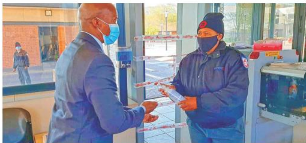
Streng protokolle word gevolg voor enige persoon die Dr Harry Surtie Hospitaal se terrein mag betree

Hulle het verder daartoe verbind om die COVID-19-reaksieveldtog te ondersteun.