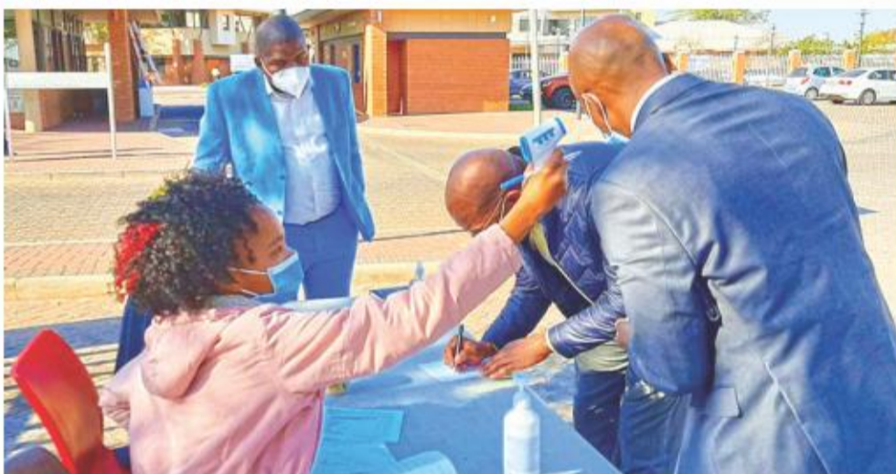
Selfs die hooggeplaastes in die provinsie moet al die gesondheidsprotokolle waarnem