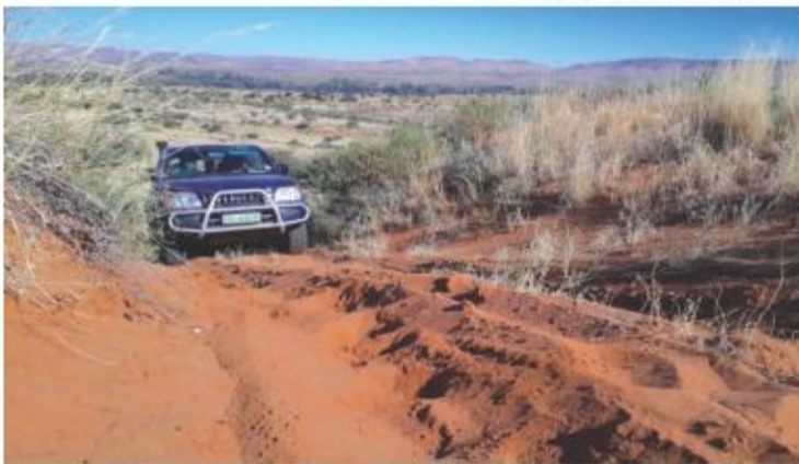
4x4 Veldkuns - studente leer om die duine korrek aan te pak met 'n 4x4 voertuig.