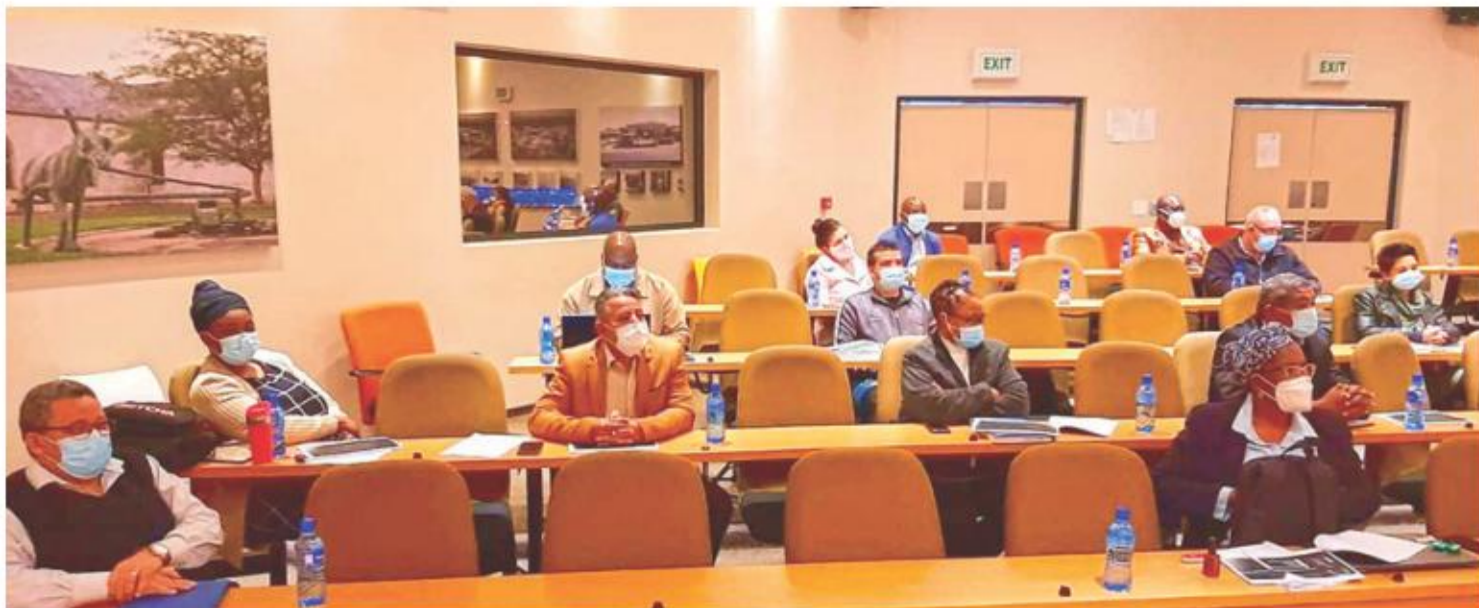
Nodeloos om te sê, is sosiale distansiering protokol tydens die vergadering by DHS gevolg