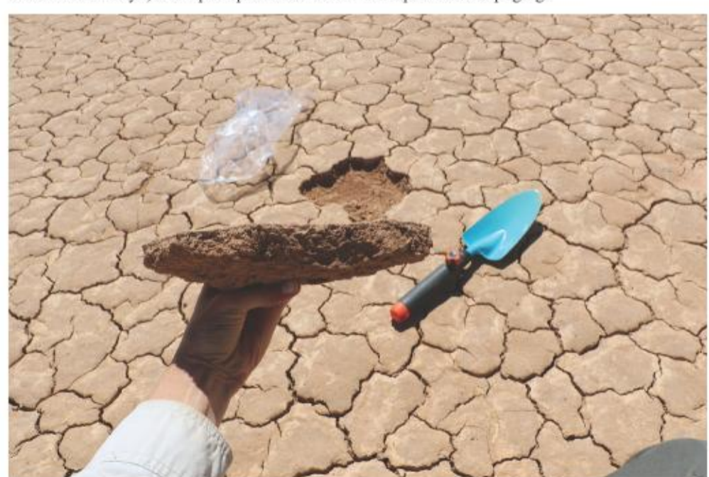
Skaaldiertjies se eierbanke kom voor in die boonste 5cm van 'n pan se kors. Hierdie eierbanke vorm die kluis wat elke pan se biodiversiteit bewaar en waarborg die voortbestaan van spesies wat daarin voorkom. Die klipharde klei help dat eiertjies nie vermorsel word nie, maar sodra die kors beskadig word, stel dit die eiertjies bloot aan verwerking.

navorsingsprojek op die biodiversiteit van panne in die Noord Kaap. Hulle het onlangs vasgestel dat 'n feetjiegarnaal wat daar voorkom nog nooit in Suid Afrika aangeteken is nie.