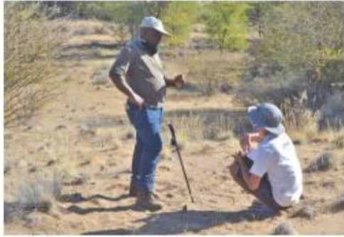
Hoe om spoor te sny en die verskillende spore in die veld, is onder andere aan die studente verduidelik.

Die twee akademiese toere wat al die teorie