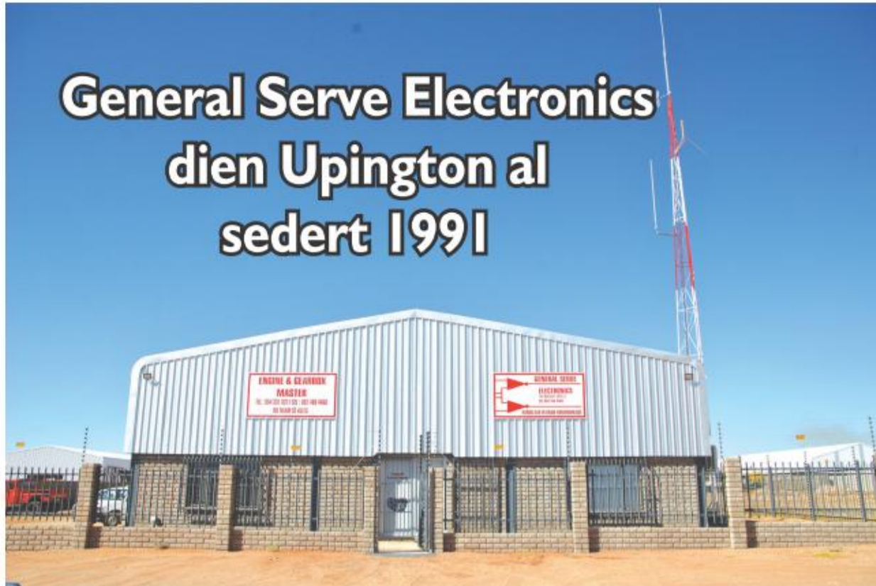
General Serve Electronics het verskuif na Merinostraat 11, Industria, Upington.