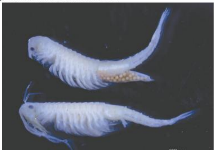
Die seldsame feetjiegarnaal Pumilibranchipus deserti , met wyfie (bo) en mannetjie (onder) wat vir die eerste keer in Suid Afrika op Hakskeenpan ontdek is, nadat dit slegs een keer gedurende die 1980s in Namibië gevind is. Die ontwikkeling van die landspoed baan en geassosieerde aktiwiteite vir die BLOUDHOUND motor op die pan, mag dalk egter die populasie se voortbestaan bedreig. Pumilibranchipus deserti is ontdek in 1986 in die KauKausib Rivier suid-oos van Ludertiz in Namibië, maar is nog nooit weer daarna gevind nie.

Hulle vul slegs na groot reënbuie en dan krioel dit vir 'n kort tydperk van unieke akwatiese organismes wat spesifiek aangepas is om te oorleef in kortstondige habitate. Branchiopoda, 'n groep varswater skaaldiertjies, maak staat op rus eiers om langdurige tydperke van droogte te kan teenstaan. Sodra dit genoeg gereën het vir 'n pan om enkel diepte te bereik, broei die skaaldiertjies uit en ontwikkel binne 'n paar dae tot volwasenheid. Hulle lê dan klomp eiers wat in die modder opgaan voor die pan weer uitdroog, om 'n eierbank te vorm.